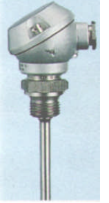
Niveau Min (Alarm)