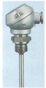
Niveau Stop Pumpe